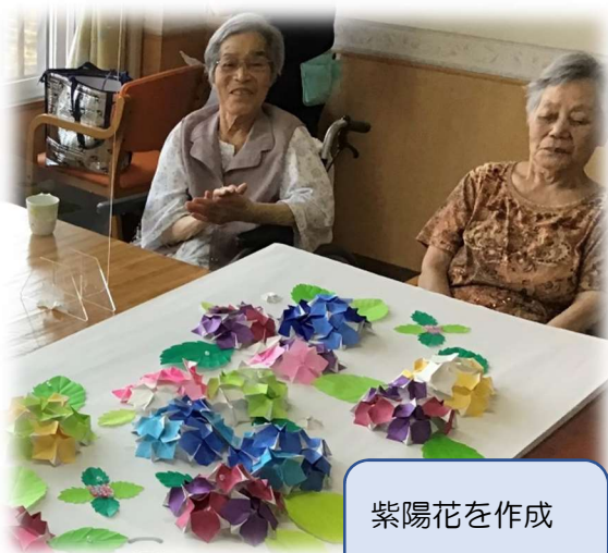
紫陽花を作成しました。

和創会では、新しくホームページを作りました。各事業所の紹介をはじめ、日頃の様子をどんどん掲載の予定です。『スタジオ和創』では、特養の様子を動画で掲載しています。「和創会」で検索して是非、ご覧ください。