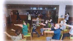
【よかよか体操】 無理なく、楽しく(^^)