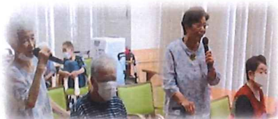
【大人気のカラオケ】 それぞれ十八番は欠かせません♪

コロナも明け少しずつ行事も増えてきました。雁回山を奥に、景色の移り変わりを一望できる食堂は皆様の憩いの場にもなっています。ご利用様が楽しみながら心身の健康づくりができるよう、日常のレクリエーションに加え、初夏は「美味しい」イベントで盛り上がりました(^^)