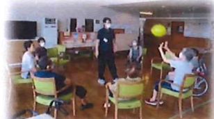
【風船バレー】 皆さん自然と笑顔になります