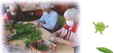
【グリーンピース皮むき大会】 昔話に花が咲きます(^^)