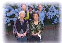
【あじさい見学ツアー】 外出行事も楽しみの一つです