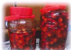
【梅干し作り】 完成が楽しみです！