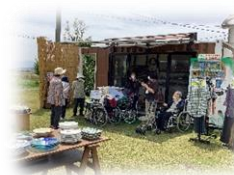
たとととマルシェ

よかひよりはたととと広場と称して親しまれています。地域の方々とマルシェや運営推進会議・消防訓練も一緒に行っています。また、敷地内にあるたととと畑では地域の方の協力のもとご利用者様と一緒に野菜を育てています。